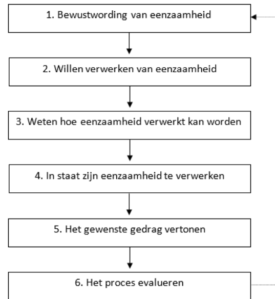
Figuur 1 Gemodelleerd model voor eenzaamheidsverwerking